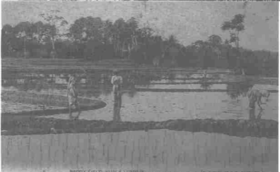
Tin-mining; removing surface soil (Cheras, Selangor).